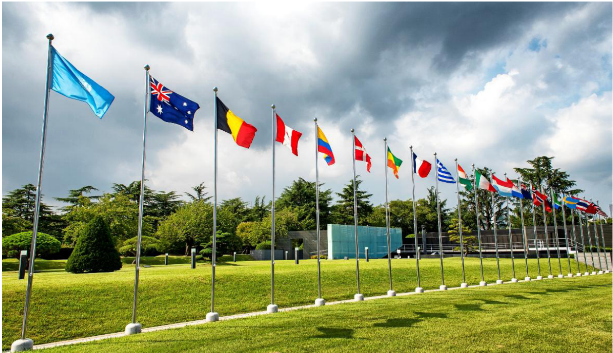
부산에 있는 세계 유일의 유엔군 묘지. 지금은 ‘유엔기념공원’으로 불린다.

7일 안전보장이사회 결의안에 따라 유엔군사령부가 설치되고, 전쟁에서의 유엔기 사용이 허가된다. 유엔군의 압도적 다수는 미군이었지만, 유엔의 깃발 아래 유럽과 남미, 아시아, 아프리카의 총 16개국이 한반도에서 벌어진 전쟁에 군대를 파병했다. 이는 국제연합 역사상 유일한 유엔군이라는 점에서 아직도 독특한 위상을 점한다.