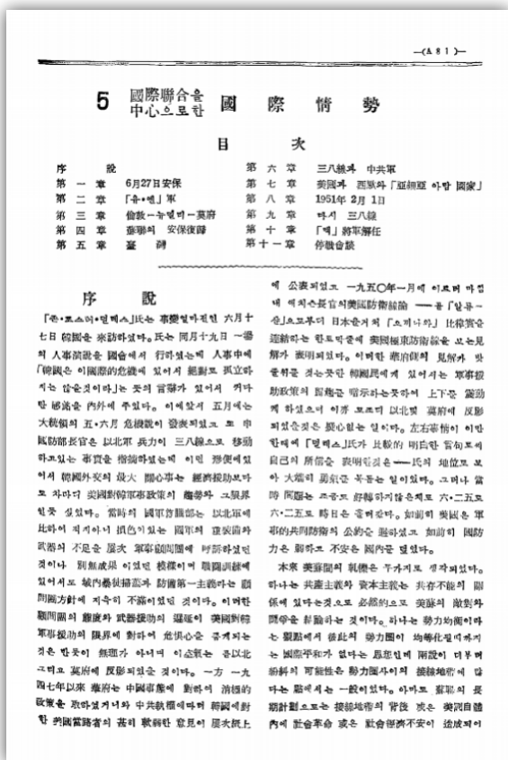
「국제연합을 중심으로 한 국제 정세」

근래 다시금 미국과 중국을 중심으로 하는 ‘신냉전’ 구도가 대중적 차원에까지 확산하면서 중국과 북한을 바라보는 대중적 인식이 경직되고, 이와 같은 분위기가 한국전쟁을 바라보는 시각에도 다시금 영향을 주고 있다. 북핵 위기 그리고