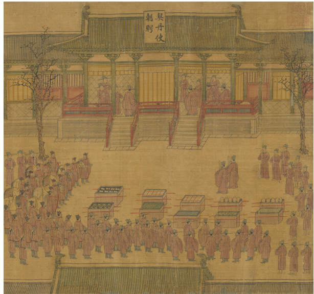
〈그림3〉 송(宋), 저자 미상, 〈경덕사도(景德四圖)〉 중 〈거란 사신이 송 황제를 알현하는 그림(契丹使朝聘圖)〉(대만 국립고궁박물원 소장)

군을 동원하여 정주민을 ‘약탈’하는 방법, 둘째 평화로운 관계에서 정주민과 ‘교역’을 하는 방법, 셋째 군사적인 우위를 바탕으로 정주민에 평화를 보장해 주는 대신 ‘공납’을 받는 방법, 넷째 정주 국가를 정복한 후 ‘직접 통치하여 징세’하는 방법이다. 이들 전략 중에서 ‘직접 통치’를 제외한 나머지 세 전략은 유기적으로 연결되어 있었다. 예를 들어, 유목민의 약탈 행위는 공납의 양을 늘리려는 전략적인 압력 수단으로 이해된다. 이러한 관점에서 보았을 때, 요가 1004년 전연의 맹 이후 송으로부터 받는 ‘세폐’는 외부로부터 받는 ‘공납’에 해당한다.