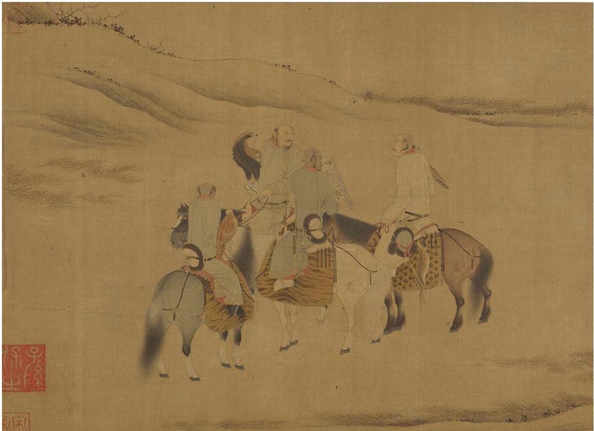
〈그림2〉 오대(五代) 호괴(胡瓌)가 그린 〈북방 유목민이 사냥 나가는 그림(出獵圖)〉(대만 국립고궁박물원 소장)

부족군을 전쟁에 동원할 때 징집 대상이 되는 부족민은 그들이 사용하는 군사 장비를 기본적으로 자체 조달하였다. 또 원정 시에는 군에 별도로 먹을 식량과 말이 먹을 풀을 지급하지 않고, 현지에서 약탈을 통해 조달하도록 하였다. 이를 ‘타초곡(打草穀)’이라고 하는데, ‘목초와 식량을 징발한다[打]’라는 의미이다. 즉 거란 황제가 부족군을 전쟁에 동원하는 대가로 약탈을 허락하는 방식이 자주 이용되었다. 이와 관련하여 1042년 증폐교섭(增幣交涉)에서 요 흥종(興宗, 재위 1031~1055)의 부족군 동원에 관한 흥미로운 이야기가 전한다.