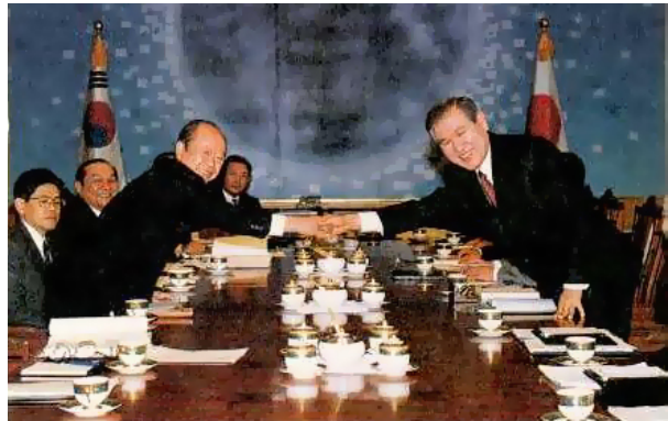
1992년 한일 정상회담

이에 한국 정부는 대일 의존도를 낮추고자 1970년대부터 중화학공업화 정책을 본격적으로 추진했다. 그런데 일본으로부터의 수입에 의존하던 금속, 화학, 전자, 조선, 자동차 등을 직접 생산하기 위해서는 소재, 부품, 장비 등을 또다시 일본으로부터 수입해야 했고, 결국 대일 무역 적자를 축소하기 위한 중화학공업화가 대일 무역 적자를 더욱 확대하는 결과를 가져왔다.