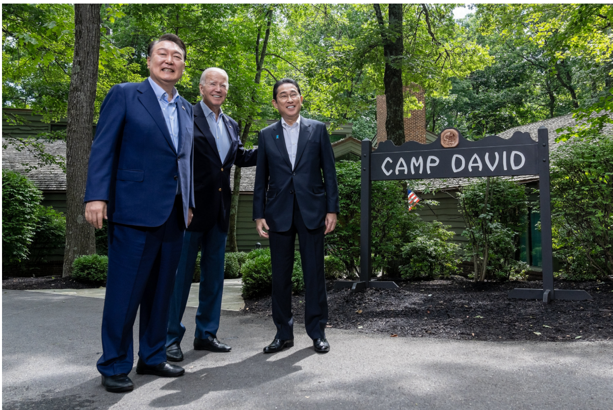
2023년 한미일 3자 정상회담

최근 10여 년간 한일 관계는 롤러코스터를 타고 있지만, 변하지 않는 원칙은 있다. 아무리 큰 정부가 강조되는 경제 안보 시대라도 경제협력의 주체는 어디까지나 기업이라는 점이다. 대중(對中) 견제의 키워