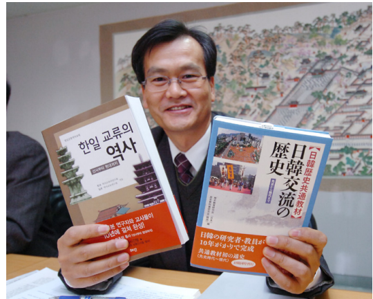
역사공통교재 『한일교류의 역사』 한일 동시 출간(2007.3.1)

된 민간의 역사대화가 있다. 1980년대부터 한국의 역사교육연구회, 한일문화교류기금, 한국교육개발원, 한일역사교과서연구회, 국제교과서연구소, 서울시립대학교, 한일관계사학회, 한일역사교육교류모임, 아시아평화와역사교육연대 등은 일본의 조에츠교육대학, 일한역사교과서연구회, 국제교육정보센터, 가쿠게이대학, 비교사·비교역사교육연구회, 일한역사교육교류모임 등과 역사인식을 둘러싼 발표와 토론을 거듭했다. 역사교과서 기술과 역사수업 등을 주로 화제로 삼았다.