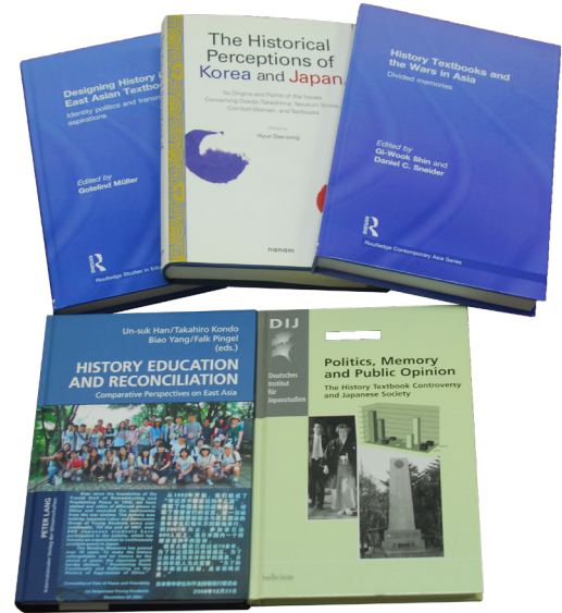
한일의 역사대립과 역사대화를 영어와 독일어로 소개한 학술서적(2003~2014)

④ 교과서위원회 양국의 역사교과서 내용을 함께 분석하고 토론하여 제1기 위원회보다 진전된 모습을 보였다. 그렇지만 공동연구 주제가 너무 추상적이어서 논문의 방향이 서로 어긋나는 경우가 더러 생겨났다. 한국 측은 한일 교과서를 모두 검토하여 상호 비교하였는데, 일본 측은 자국사 교과서는 일절 다루지 않고 한국사 교과서만 검토하였다. 교과서 문제를 허심탄회하게 논의하기에는 아직도 서로 오해와 편견의 벽이 두껍다는 인상을 주었다.