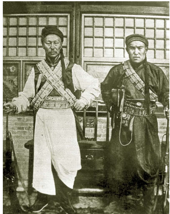
1911년 몽골 혁명 당시의 반중 몽골인들

1911년 신해혁명이 발발하자 몽골인들은 그해 12월 1일 청으로부터의 독립을 선언했다. 그러나 이듬해에 성립된 중화민국이 청나라의 계승자임을 자처하고 몽골에 대한 종주권을 주장하여 몽중 관계가 복잡해졌다. 이때부터 제정러시아와 중국 사이에 이른바 ‘몽고문제(蒙古問題)’를 놓고 밀고 당기는 외교 교섭이 시작되었다. 그 후 역대 중화민국 정부는 몽골의 독립을 인정하지 않다가 장제스의 국민 정부가 제2차 세계대전 이후 강대국의 압력으로 마지못해 몽골의 독립을 수용하였고(1946년 1월 5일), 중화인민공화국 성립 후에는 소련의 권유로 몽골과 외교 관계를 수립했다(1949년 10월 16일). 그러나 신해혁명 직후 성립된 민국 정부는 물론이고 장제스의 국민 정부, 심지어 마오쩌둥의 신중국 정부까지도 몽골의 독립 승인과는 별개로 몽골을 자국 영토로 편입시키려고 끊임없이 시도했다. 1956년 중국에서 출간된 지도에 몽골인민공화국과 중화인민공화국의 국경선 표시가 미정(未定)을 뜻하는 ‘가는 점선’으로 되어 있는 반면, 몽골인민공화국과 소련의 국경선은 이정(已定)을 뜻하는 ‘굵은 점선’으로 되어 있는