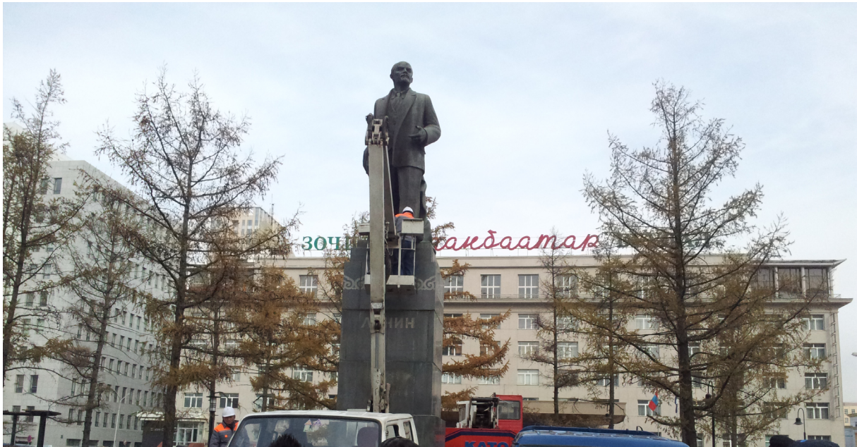
울란바타르에 있던 레닌 동상 철거 모습

2012년 가을, 반세기 이상 울란바타르 중심부에 자리 잡고 있던 레닌 동상의 철거에 즈음하여 로이터 통신 기자의 질문에 에르덴빌릭(D. Erdenebileg, 당시 55세)이라는 운전사가 한 답변이다. 바로 이런 이유로 레닌 동상은 체제 전환 10년 후인 2012년 10월 14일까지 울란바타르 도심 한가운데에 머물 수 있었을 것이다. 정리하자면, 공산 체제의 폭정을 비판하면서도 다른 한편으로는 러시아인에게 고마워하는 이중적인 정서가 1990년대 전환기 소비에트 체제와 러시아인에 대한 몽골인의 보편적인 정서였다. 그리고 이러한 정서의 큰 줄기는 지금까지도 이어지고 있다고 할 수 있다.