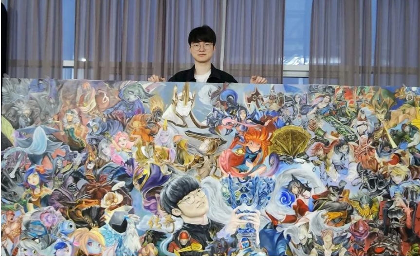
중국인 팬이 페이커를 위해 2년 반 동안 그리고 한국까지 가져온 그림

갈등과 한한령(限韓令) 사태를 겪으면서 현저히 약화하였다. 이는 기본적으로 중국 산업구조와 양국 무역구조의 변화에 따른 것이지만, 다른 한편으로는 미중 패권경쟁 구도가 동북아 무대에서 표면화한 데 따른 것이다. 최근에는 러시아·우크라이나전쟁을 배경으로 미중 패권경쟁이 첨단산업의 글로벌 공급망 구조 재편과 맞물려 전개됨에 따라 전통적인 안보 영역과 경제 영역이 얽히는 이른바 경제·안보 연동체제가 확산하면서 한중 관계가 더욱 경색되고 있다.