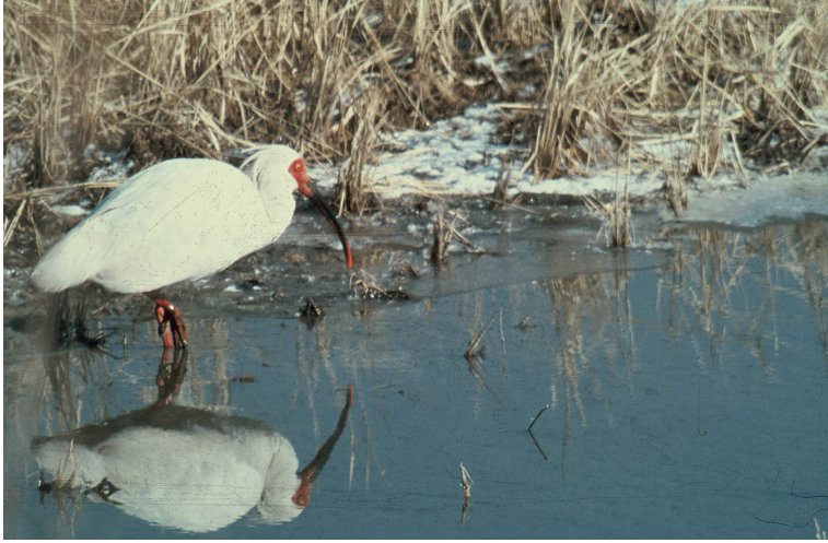
1979년 한국 비무장지대의 마지막 따오기