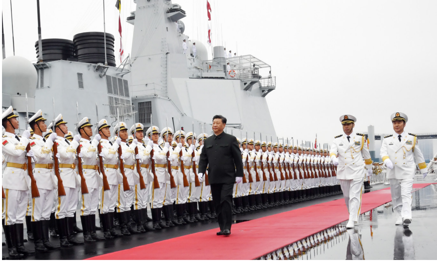
인민해방군 해군 의장대를 사열하는 시진핑 주석(중국 칭다오, 2019. 4. 23,)

에, 10년 이후(2023) 주요 대국들의 국제적 지위를 전망한 바 있다. 그의 전망에 의하면, 미국은 여전히 패권국가로서 중국과 양자 구도를 형성할 것이고, 중국은 미국을 추격해 세계의 중심을 동아시아로 이동시킬 것이고, 일본은 2류 국가로 전락해 지역대국의 자리를 차지할 뿐이고, 러시아는 개발도상국으로서 아무런 힘을 쓰지 못할 것이라고 했다.