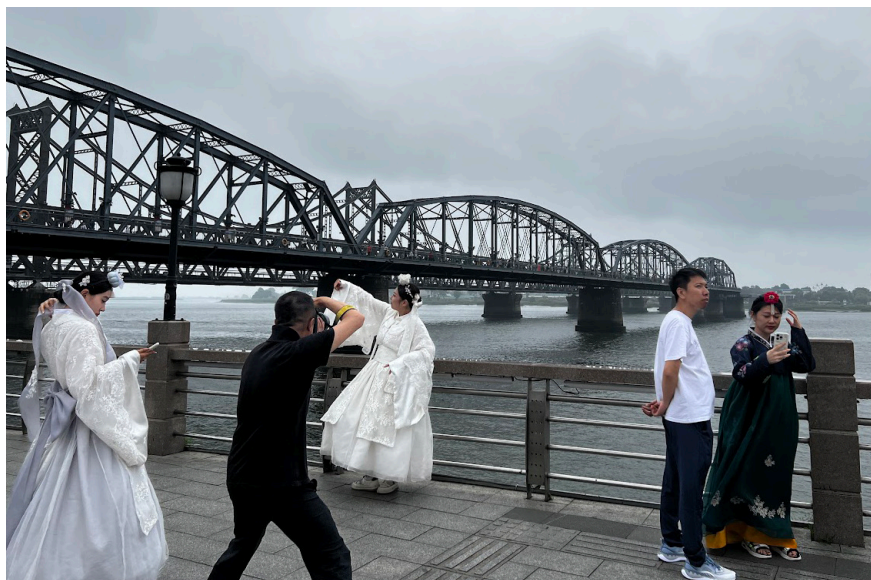
개량한복을 입고 사진을 찍는 사람들(2023)

리에서 동북 경제 발전을 위해 교수나 박사 등 고급 인력은 베이징(北京), 상하이(上海), 광둥(廣東) 등 경제 발전 지역으로 이주하는 것을 금지한다는 결정이 내려졌다는 소식이 전한다. 인재 유실을 막아 지역을 발전시키겠다는 교육책을 불사할 정도로 동북은 위기다.