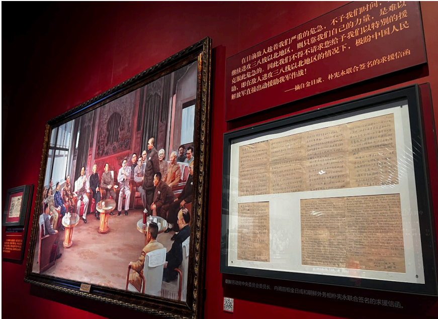
김일성과 박헌영이 마오쩌둥에게 보낸 편지 사본(항미원조기념관 소장)