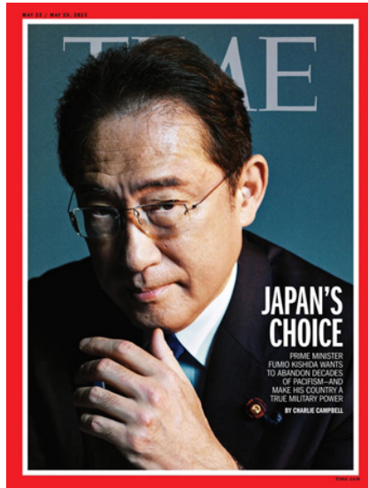
『타임』 표지에 실린 기시다 총리(2023. 5. 9)

계획을 밝히고, 미국과 오키나와에 주둔 중인 해병대 부대를 개편하는 데에도 합의했다. 개편한 부대는 혹시 모를 타이완 유사사태에 더욱 빠르게 대응할 수 있다고 한다. 18 이에 대해 미국의 언론 『타임(TIME)』 인터넷판(2023. 5. 9)은 “기시다 총리는 수십 년에 걸친 평화주의를 포기하고 일본을 진정한 군사대국으로 만들려고 한다”는 제목의 기사를 게재한 바 있다.