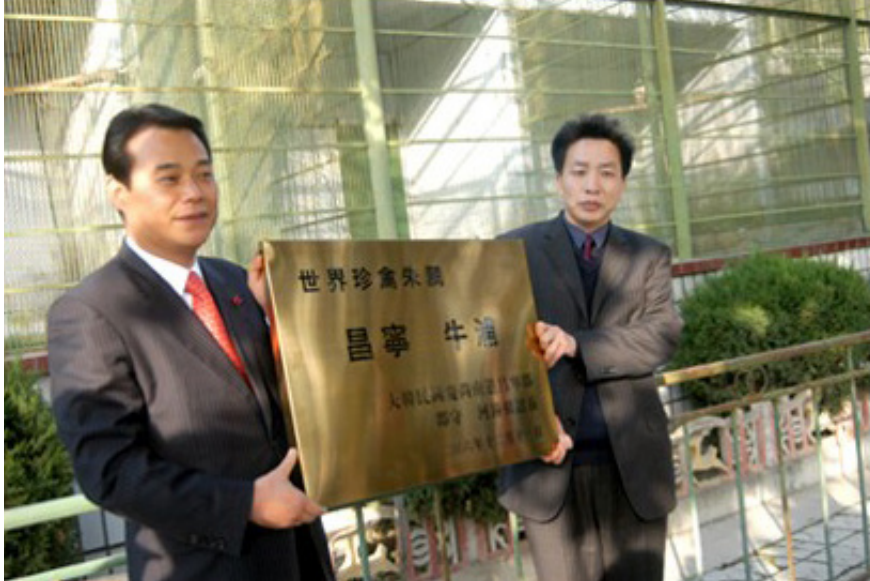
중국 산시성 한중시 양현 따오기복원센터 사육비 지원 현판식(2006. 12. 11)