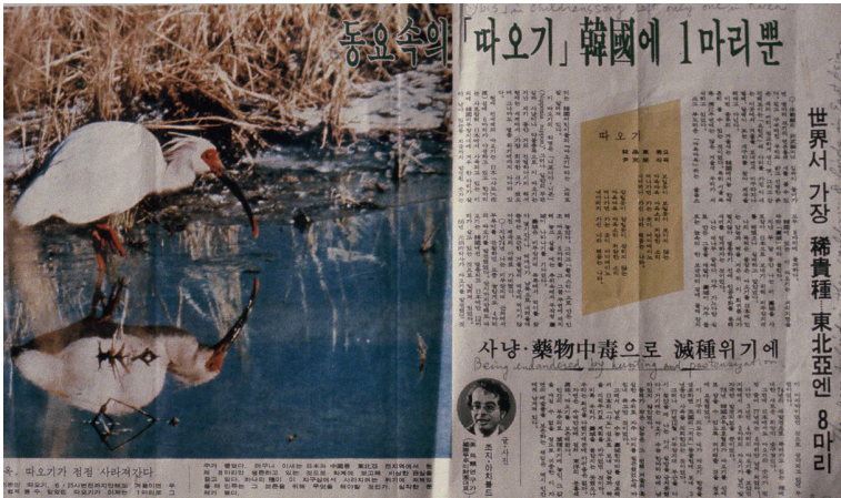
동요 속의 「따오기」 한국에 1마리뿐(『중앙일보』 1979.3.14)