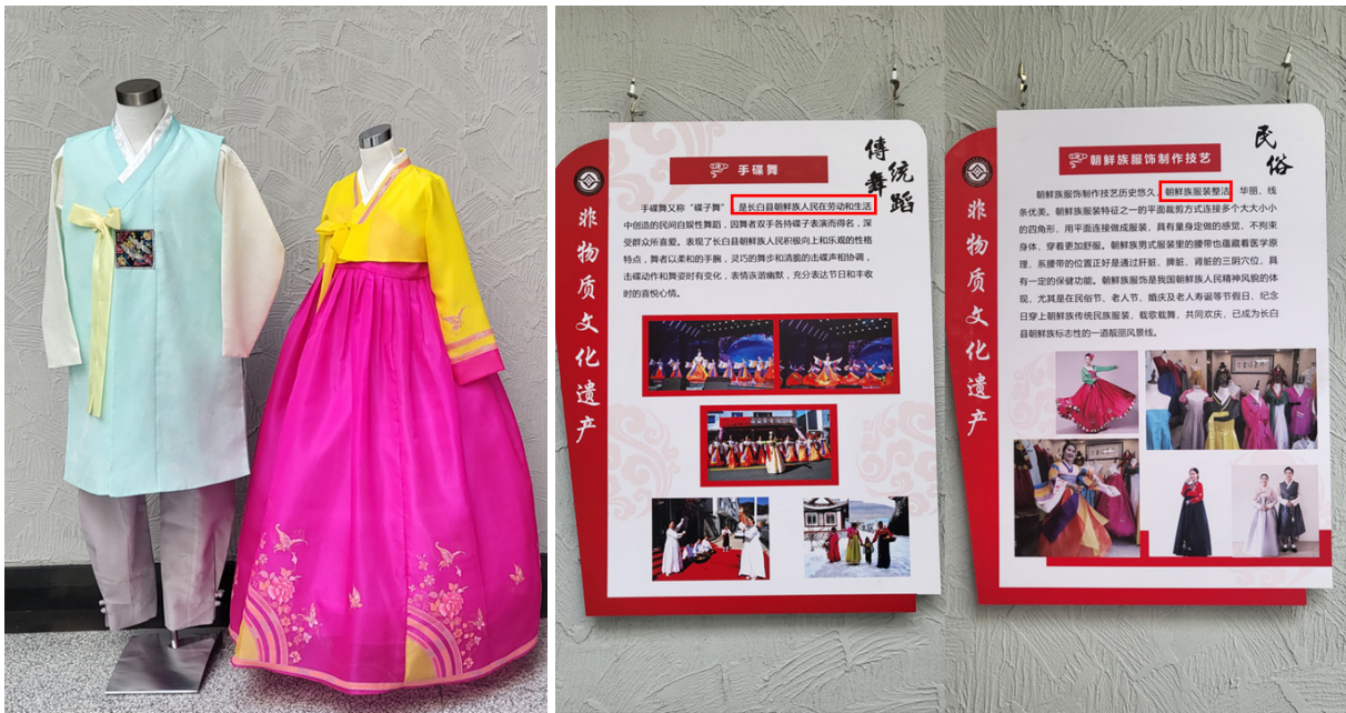
만주족박물관의 창바이산 무형문화유산 전시 중 한복과 전통 한국 춤(2023년 8월 26일)

쪽으로 너인고성과 일직선상에 있다. 창바이산에서 만주족이 탄생하고 문화가 발아했다는 것을 주제로 만주족의 지역적 특색과 문화를 전시하고 있는데, 주로 백두산에서 탄생한 만주족의 문화만을 강조하는 분위기이다.