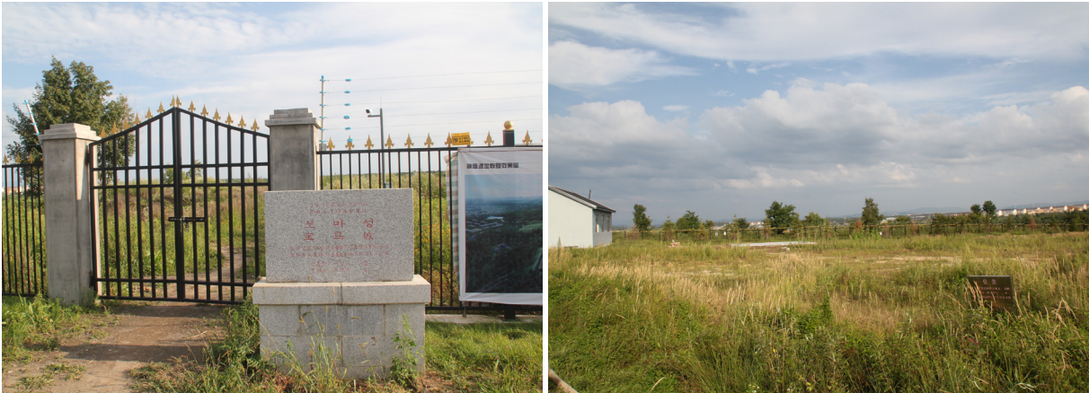
바오마성 유적 표지석과 유적지 발굴 현장(2018년 8월 20일)

흔적이 있고 비닐로 덮여 있었다. 유적지 바로 옆에는 현장사무소가 있었고, ‘금대 창바이산 신묘 유적지 사무실’이라는 현판이 걸려 있었다. 2023년 현재 모습도 같다.