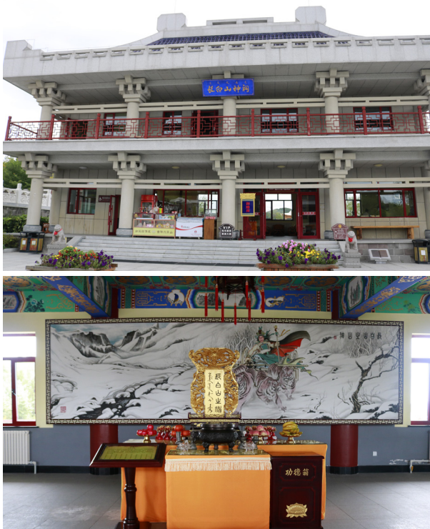
창바이산 신사와 제단(2018년 8월 20일)

길-말갈-여진족-만주족'으로 이어지는 중국 사로 편입하려고 백두산을 활용한 것이다. 류딩산 문화명승지에는 불교 문화와 관련한 사찰과 불상 등도 조성되어 있다. 청조사 내부에는 여진족 시조 부쿠리용순부터 청조 마지막 황제 푸이에 이르기까지 금과 청 역대 왕들의 동상이 3m 이상 되는 높이로 세워져 있다. 벽면에는 부쿠리용순의 탄생 신화부터 청의 건국과 역사가 그려져 있다. 특히 부쿠리용순의 강인한 모습을 표현한 동상과 그의 탄생 설화의 배경으로 '창바이산'을 강조한 부분이 눈에 띈다.