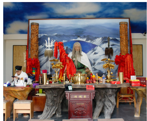
기복신앙의 백두산신(2023년 8월 25일)