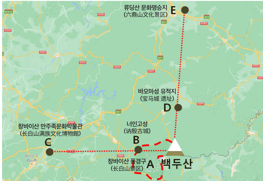
백두산 주변 ‘창바이산 문화론’ 개발 유적지 분포도(필자가 구글 지도 위에 간략하게 표시한 것임)

백두산을 중심으로 북쪽과 서쪽으로 확산한 ‘창바이산 문화론’ 개발 유적지 현황은 아래와 같다.