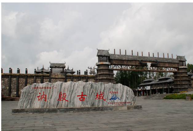
너인고성의 한복 체험 장소(2023년 8월 25일)