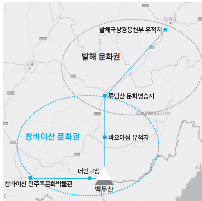
‘창바이산’ 발해 문화권

즉 ‘발해 문화권’ 개발은 ‘백두산-바오마성-류딩산 문화풍경구’로 이어지는 ‘창바이산 문화권’과 맥을 같이한다. 그리고 둔화에서 무단강(牡丹江)을 따라 연결하려는 움직임과도 맥을 같이한다. 백두산과 발해 유적을 중국 고대사로 편입하려는 큰 그림이 보인다.