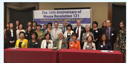
[자료10] 미국 하원 일본군'위안부' 결의안 채택 10주년 기념 행사

① [자료8]~[자료10]과 같이 세계 각 지역 사람들이 일본군'위안부' 문제 해결을 위해 다양한 노력을 하는 이유는 무엇일까?