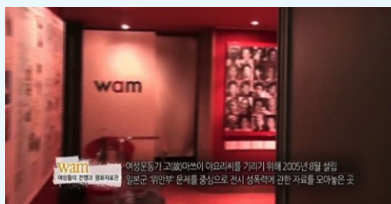
[자료9] wam 사무국장 와타나베 미나 인터뷰